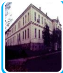
Selanik Mülkiye Rüştiyesi

Babasının isteği ile gittiği bu okul Selanik'in ilk özel Müslüman okuludur. Mustafa Kemal bu okulda modern bir eğitim görmüştür. Bu okulda iken babası 1888 yılında vefat edince kısa sürede olsa eğitim hayatı kesintiye uğramıştır.