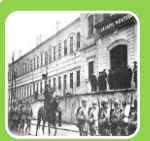
İstanbul Harp Okulu

Mustafa Kemal,1899 Yılında İstanbul'a giderek Harp Okulu'nun Piyade Bölümüne girdi. 1902'de bu okulu teğmen rütbesiyle bitirdi ve öğrenimine Harp Akademisi'nde devam etti. Atatürk, bir yandan öğreniminde başarılı olmak için sürekli çalışıyor bir yandan da ülkenin kaderine kafa yoruyordu. Zira ülkenin siyasetinde yanlışlar olduğunu fark etmişti. Ülkedeki yanlışlar hakkında herkesin bilgi sahibi olmasını isteyen Atatürk, el yazısı ile gazete hazırlama ve okul içinde dağılmasını sağlıyordu.