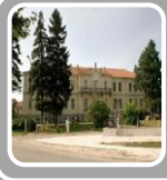
Selanik Askeri Rüştiyesi

Mustafa Kemal'in askerlik mesleğini seçerken çevresindeki askeri kişiliklerden etkilenmiştir. Bu durum Mustafa Kemal'in meslek seçiminde sosyal çevresinin etkili olduğunu göstermektedir.