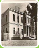
Şemsi Efendi İlkokulu

Mustafa Kemal öğrencilik yıllarında dini eğitim veren medrese ve mektepler, askeri okullar, modern okullar, yabancı okulları, azınlık okulları bulunuyordu. Bu durum Osmanlı Devleti'nde eğitim birliği olmadığını göstermektedir.